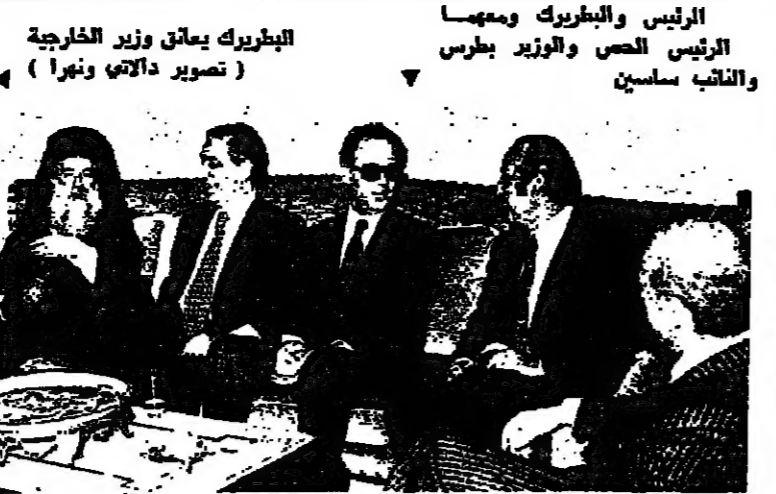
الرئيس والوزير بطرس... (تصوير دالاتي ونبرا)

الطباطبائي والوزير اللبناني... (تصوير دالاتي ونبرا)